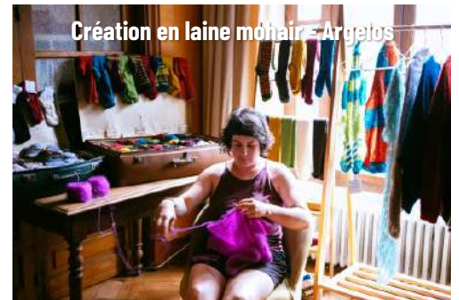
Création en laine mohair - Argelos