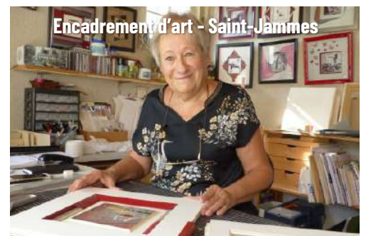
Encadrement d'art - Saint-Jammes