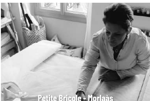
Petite Bricole - Morlaàs