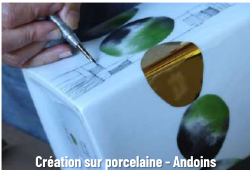
Création sur porcelaine - Andoins