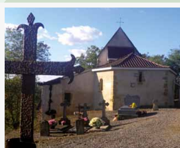
La chapelle Saint Michel (Chapelle de Moustrou) s'inscrit dans un ensemble fortifié de la fin du XV e voire début XVI e et a sans doute succédé à une chapelle castrale. À l'intérieur : dalles funéraires des barons de Moustrou (1675 à 1715).

4 Prenez ensuite sur votre gauche par le calvaire (la vierge) jusqu'à l'Église (info voir PR2A les palombières) et la maison Belluix.