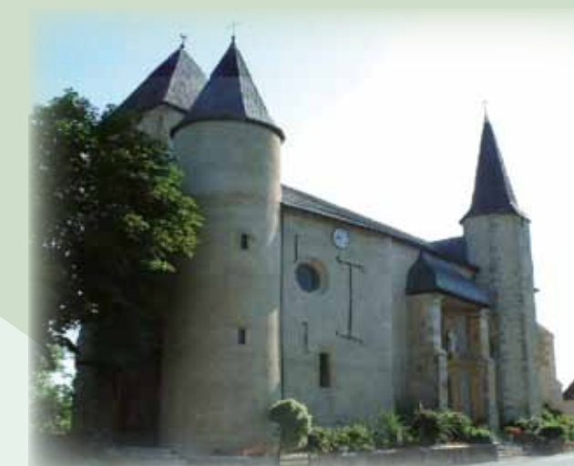
L'église Saint Laurent (attestée dès le X e siècle). Les parties les plus anciennes remontent au XIII e comme la massive tour-docher à l'Ouest. Riche mobilier du XVII e . Gaston Fébus au XIV e réalise des travaux dits défensifs. Durant les guerres de religion l'édifice devient un temple, puis est rendu au culte catholique sous Louis XIII.