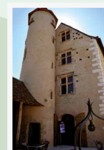
La Maison Belluix Datant du XV e , elle possède 2 étages carrés et un étage de combles desservis par une tour à escalier circulaire. L'édifice abrita une minoterie au XX e s. et accueille aujourd'hui un espace dédié à une médiathèque et la cuisine du Béarn et de l'Adour.