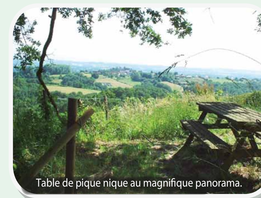
Table de pique nique au magnifique panorama.

Une traversée au cœur des palombières. Durant la migration automnale, la passion bleue s'empare du Soubestre. Alors faites preuve de silence et de discrétion. Levez les yeux et vous les verrez passer !!