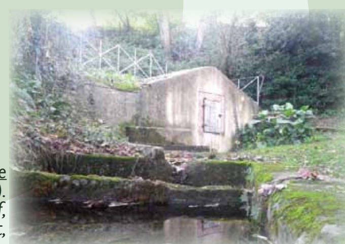
Fontaine de la Carrère Elle se trouvait proche d'un couvent aujourd'hui disparu (ferme auberge de nos jours). Equipée d'auges, de lavoirs et d'un bassin couvert avec son volet fermant à clef, elle représentait, avec la fontaine de Benteyoc, l'un des deux seuls points d'eau mis à la disposition des villageois.