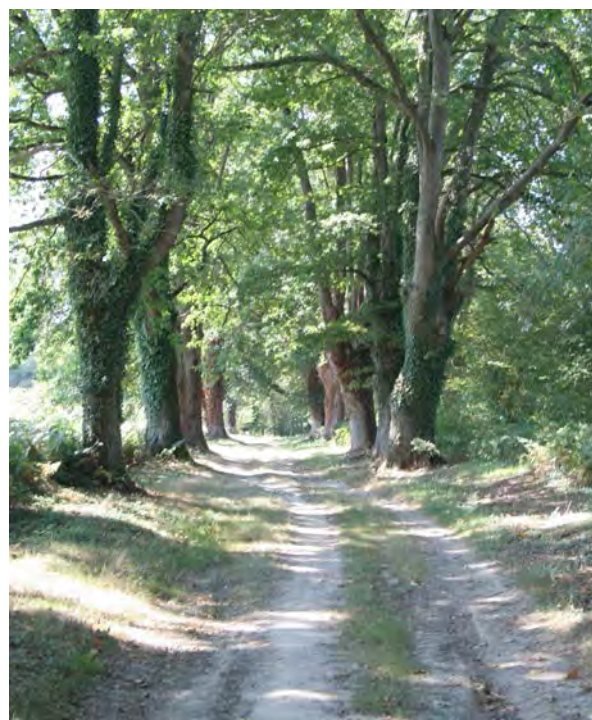
Allée ombragée à Carrère.

2 La piste plonge jusqu'aux abords du Gabas pour passer sous le viaduc de l'A65, et remonter ensuite dans le coteau boisé de Carrère. Au retour sur le plateau, passer entre les deux premières habitations puis tourner à droite 400m plus loin pour rejoindre le point de départ.