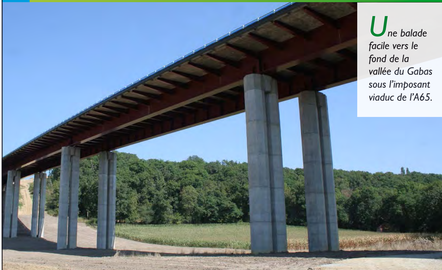
Le viaduc de l'A65 sur le Gabas à Lalouquette.

U ne balade facile vers le fond de la vallée du Gabas sous l'imposant viaduc de l'A65.