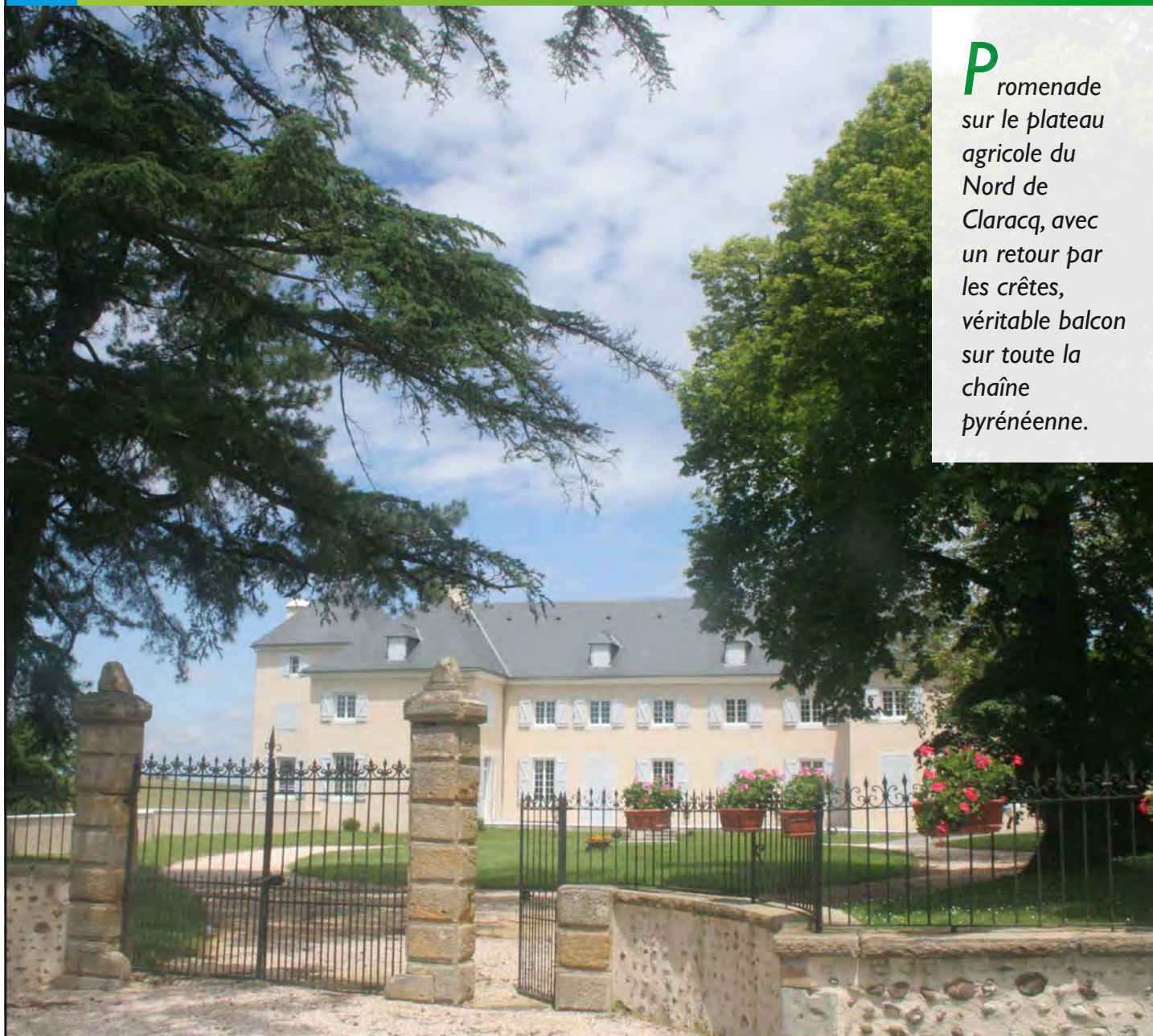
Le château de Claracq.

P romenade sur le plateau agricole du Nord de Claracq, avec un retour par les crêtes, véritable balcon sur toute la chaîne pyrénéenne.