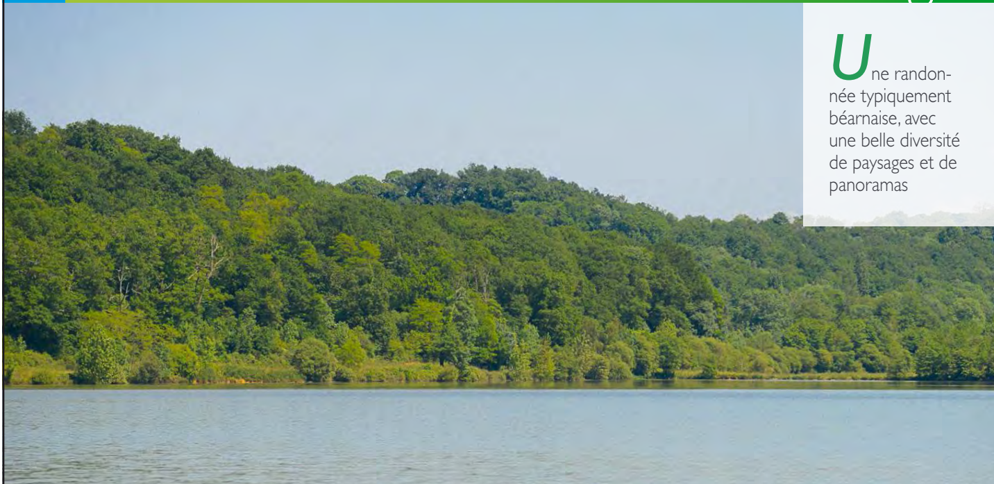
Le lac et le coteau boisé d'Argelos.

Une randonnée typiquement béarnaise, avec une belle diversité de paysages et de panoramas