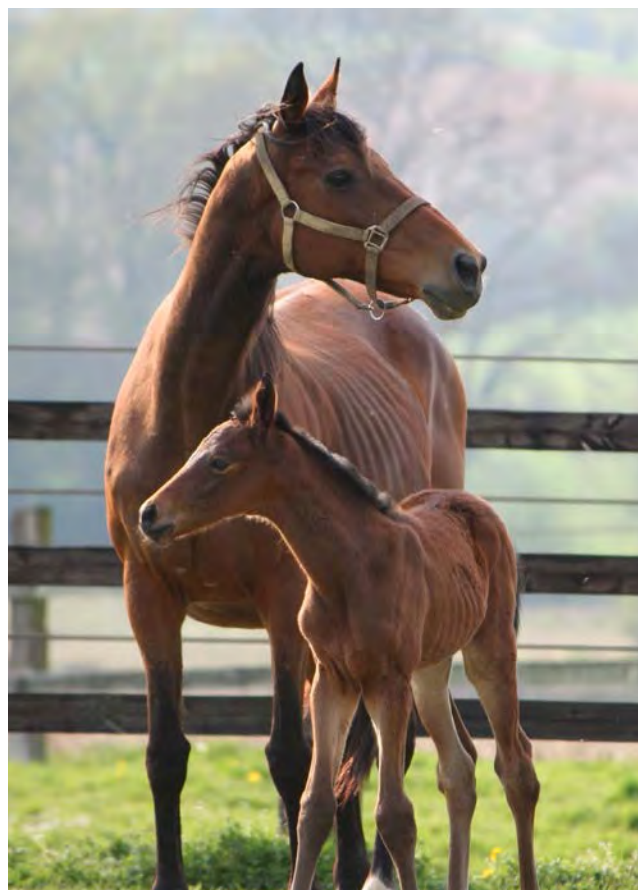
Elevage de Viven.

3 Tourner à droite et rester sur la voie principale qui vous ramène au centre d'Argelos en prenant à droite au second carrefour.