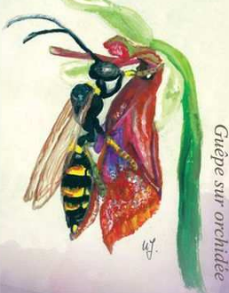
Grièpe sur orchidée

Les orchidées accueillent aussi plusieurs espèces de pollinisateurs qui viennent les visiter en croyant voir en elles un partenaire potentiel.