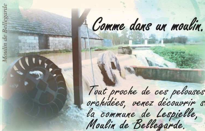
Moulin de Bellegarde

Tout proche de ces pelouses à orchidées, venez découvrir sur la commune de Lespielle, le Moulin de Bellegarde.