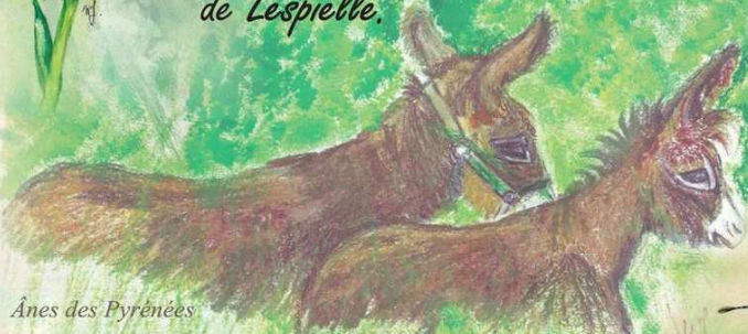
Ânes des Pyrénées

Sur le canton de Lembeye, environ 90 hectares sont aujourd'hui gérés en partenariat entre la Communauté des Communes du Canton de Lembeye et le CEN Aquitaine.