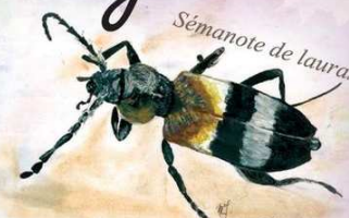
Sémanote de lauras