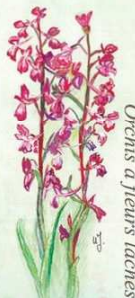
Orchis à fleurs lâches

Les pelouses abritent une flore spécifique, adaptée à la pauvreté du sol et aux conditions de sécheresse, liées à l'exposition et à la pente.